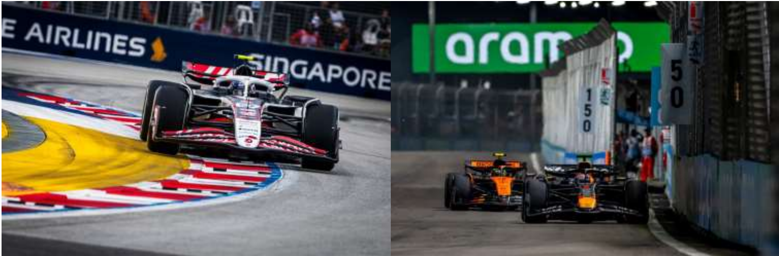
ชม รอบ SPRINT RACE + QUALIFYING

**เดินทางด้วยตนเอง เข้าร่วมงาน FORMULA 1 SINGAPORE GRAND PRIX 2026**